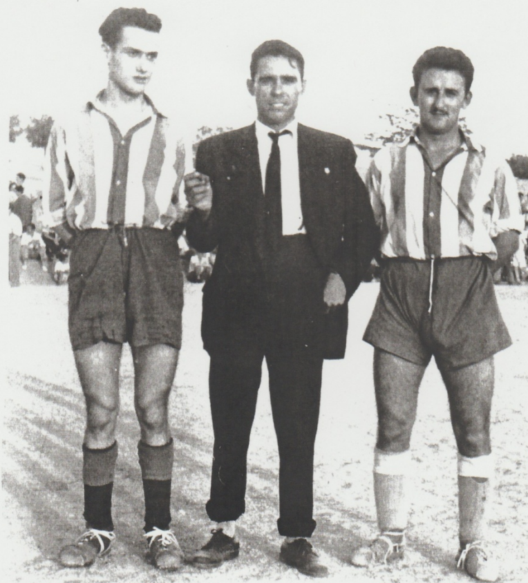
“CACHARRITO,” “PIPE,” MANGAS.