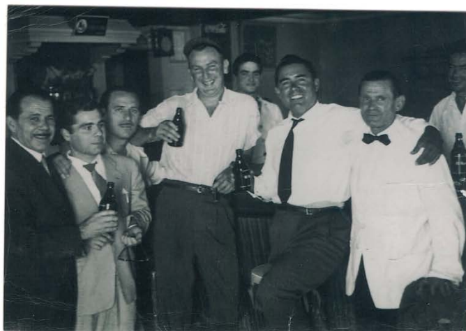
PADRE DE PEPIN, PEPÍN, AFICIONADOS, PIPE