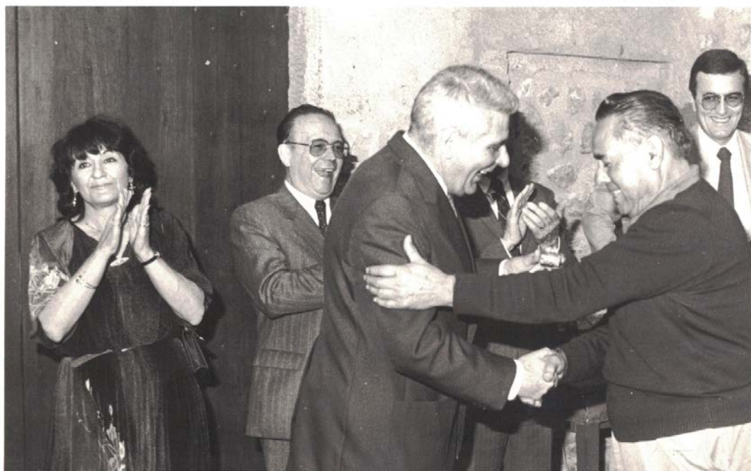
- Pipe saludando al Sr. Alcalde de Narbona en la recepción de su Ayuntamiento-